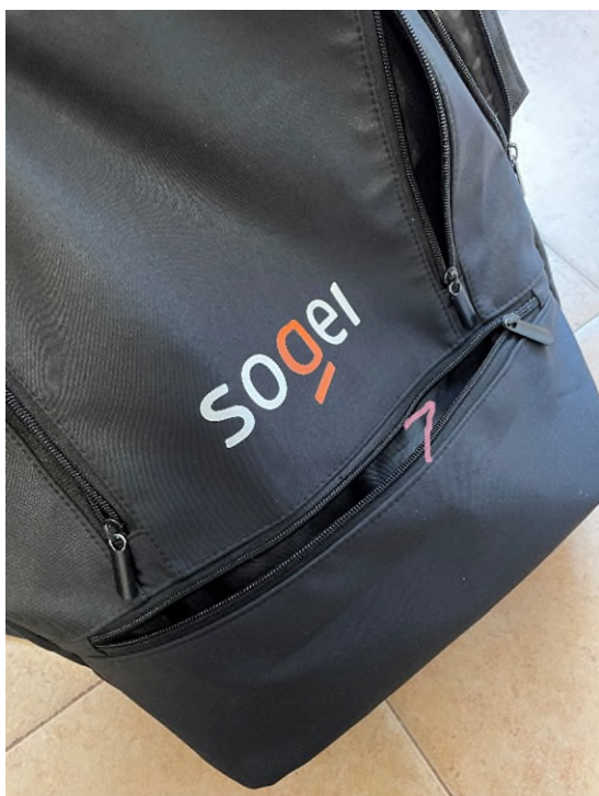
Immagine 3 – terzo comparto

N°2 - una tasca piccola portamonete con chiusura lampo