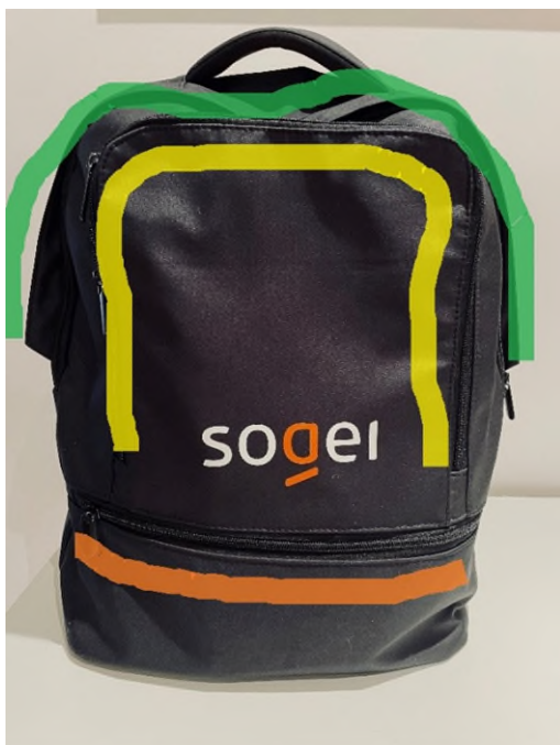
Immagine 4 – i compartimenti