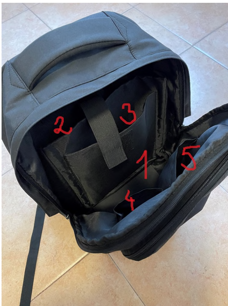
Immagine 1 – primo comparto

Le seguenti immagini sono tutte immagine indicative.