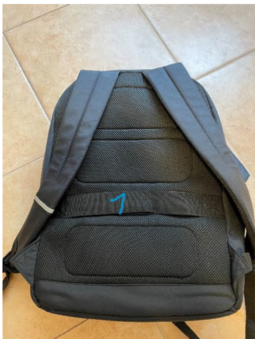
Immagine 6 – cinghia per il bagaglio

N° 1 - cinghia per il bagaglio in modo da poter fissare lo zaino sulla valigia