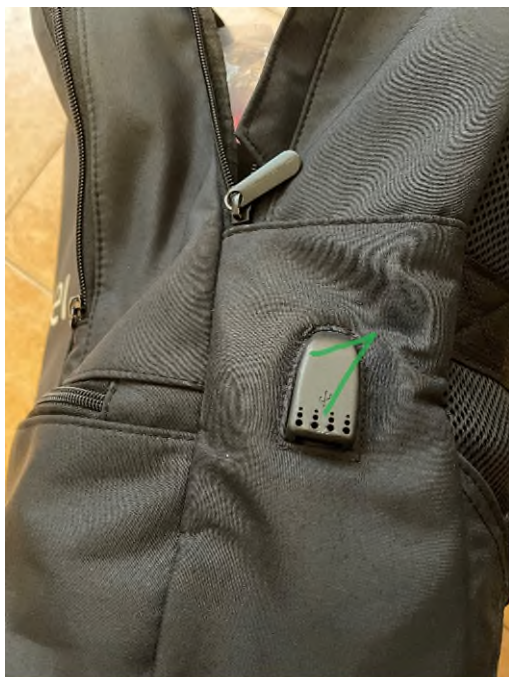
Immagine 5 – la porta USB

N°1 - la porta USB esterna con cavo di ricarica integrato (il cavo non è presente in foto)