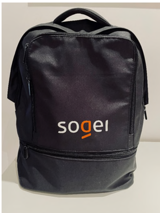
Immagine 7 – forma zaino

N° 1 - cinghia per il bagaglio in modo da poter fissare lo zaino sulla valigia