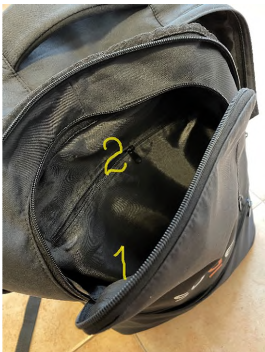
Immagine 2 – secondo comparto

N° 1 - una tasca grande porta documenti/oggetti;